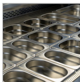
Conçu pour des bacs GN1/1, non fournis