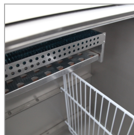
Système de cloisons